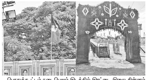
பொதுக்கூட்டம் நடைபெறும் இடத்தில் இரட்டை இலை சின்னம் பொறிக்கப்பட்ட வளைவு மற்றும் கொடிகளை படத்தில் காணலாம்.

ஏற்றம் வரப்போகிறது. நாளை தொடர்பில்லாத நபர்கள் இந்த தமிழகம் எதிர்பார்க்கும் கட்சியின் கொடி மற்றும் மாற்றமும், ஏற்றமும் அளிக்கும் கூட்டமாக இது அமையும்.