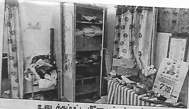
உடைக்கப்பட்ட பீரோ மற்றும் வாக்கர்.

அப்போது வீட்டின் பின்பக்க கதவு உடைக்கப்பட்டு இருந்தது. சென்று பார்த்தபோது பீரோ உடைக்கப்பட்டு இருந்தது. மேலும் வாக்கரூ